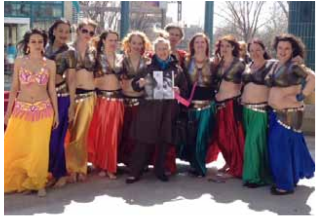
Danseuses du ventre

Il faisait particulièrement froid à Winnipeg le 11 mai, mais cela n'a pas empêché les femmes d' Au Set Belly Dance Emporium de célébrer la journée mondiale de la danse du ventre, à l'extérieur, à The Fork . Au Set a tenu un encaissement silencieux au bénéfice d'Au-delà des frontières ECPAT Canada. Plusieurs membres du Conseil d'administration d'Au-delà des frontières et des bénévoles ont appuyé l'évènement.