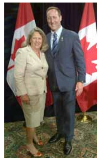
Rosalind Prober et le ministre de la Justice Peter MacKay

Au-delà des frontières ECPAT Canada a exercé des pressions pour une législation complète destinée à protéger les enfants de la cyberintimidation. La Loi sur la protection des Canadiens contre la cybercriminalité (Projet de loi C-13) a été présentée le 20 novembre 2013.