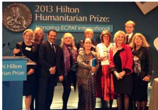
ECPAT International – Gagnant du Prix humanitaire Hilton 2013.